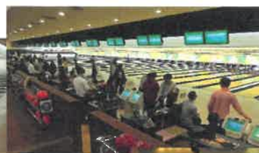
<松岳支部長：華麗なホームで始球式>